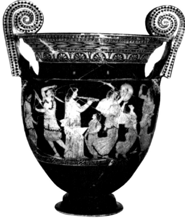
Resim-3: Ferrara'dan Kırmızı Figürlü Attika Krateri, B yüzü. M.Ö. 5. yy başı.

Roller, Lynn E. (2004). Ana Tanrıça'nın İzinde- Anadolu Kybele Kültü (B. Avunç, Çev.). İstanbul: Homer Kitabevi, s. 157.