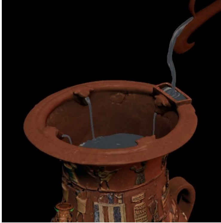
Resim- 1: İnandık Vazosu ağız kısmı mekanizması. M.Ö. 17. yy. ortaları.

İnandık vazosu M.Ö. 17. yüzyıl ortalarında bir sıvı kabı olarak kullanılmak üzere kırmızı çamurdan şekillendirilmiştir. İnandık vazosu döneme ait özelliklere ışık tutan bir vazo olma özelliği taşımakla birlikte aynı zamanda bu dönem içinde üretilen vazolardan pek çok açıdan farklılıklar göstermektedir. Vazonun dört kulpu vardır ve üzerindeki bezemeler dört farklı bölümde kabartmalı olarak işlenmiştir. Form üzerine yapılan kabartmalar renklendirilmiştir. Vazonun dışarıya doğru açılan ağız kısmının ortasını içi boş bir boru çevrelemektedir. Borunun iki ucu da, ağız kenarı üzerindeki dikdörtgen bir yapıya açılmaktadır (Resim-1). Tekneye koyulan içki, borulardan akarak kutsal sayılan dört tane boğa başından vazonun içine akmaktadır (Darga, 1992: 63). Boyunun üst kenarını oluşturan bant, kırmızı ve beyaz astar ile yapılmıştır. Boynun üst kısmı kulpun üzerinde merkezi konumdadır.