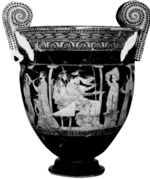
Resim-2: Ferrara'dan Kırmızı Figürlü Attika Krateri, A yüzü. M.Ö. 5. yy başı.

Kraterin üstündeki ana sahnede, Dor sütunlarıyla çerçevelenmiş naiskos içinde oturan tanrı ve tanrıça resmedilmiştir. Tanrıçanın başındaki taç ve sol koluna tünemiş olan aslan, bunun Kybele/ Meter olduğunu gösterir (Resim- 2). Resimlerde görüldüğü gibi tanrısal çifte yönelik yapılan ayinler esas vurgulanmak istenen noktadır (Roller, 2004: 155).