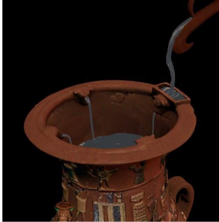
Resim- 1: İnandık Vazosu ağız kısmı mekanizması. M.Ö. 17. yy. ortaları.

İnandık vazosu M.Ö. 17. yüzyıl ortalarında bir sıvı kabı olarak kullanılmak üzere kırmızı çamurdan şekillendirilmiştir. İnandık vazosu döneme ait özelliklere ışık tutan bir vazo olma özelliği taşımakla birlikte aynı zamanda bu dönem içinde üretilen vazolardan pek çok açıdan farklılıklar göstermektedir. Vazonun dört kulpu vardır ve üzerindeki bezemeler dört farklı bölümde kabartmalı olarak işlenmiştir. Form üzerine yapılan kabartmalar renklendirilmiştir. Vazonun dışarıya doğru açılan ağız kısmının ortasını içi boş bir boru çevrelemektedir. Borunun iki ucu da, ağız kenarı üzerindeki dikdörtgen bir yapıya açılmaktadır (Resim-1). Tekneye koyulan içki, borulardan akarak kutsal sayılan dört tane boğa başından vazonun içine akmaktadır (Darga, 1992: 63). Boyunun üst kenarını oluşturan bant, kırmızı ve beyaz astar ile yapılmıştır. Boynun üst kısmı kulpun üzerinde merkezi konumdadır.